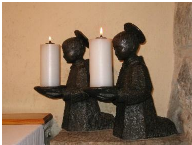
Kapelica sv. Bonaventure, La Verna